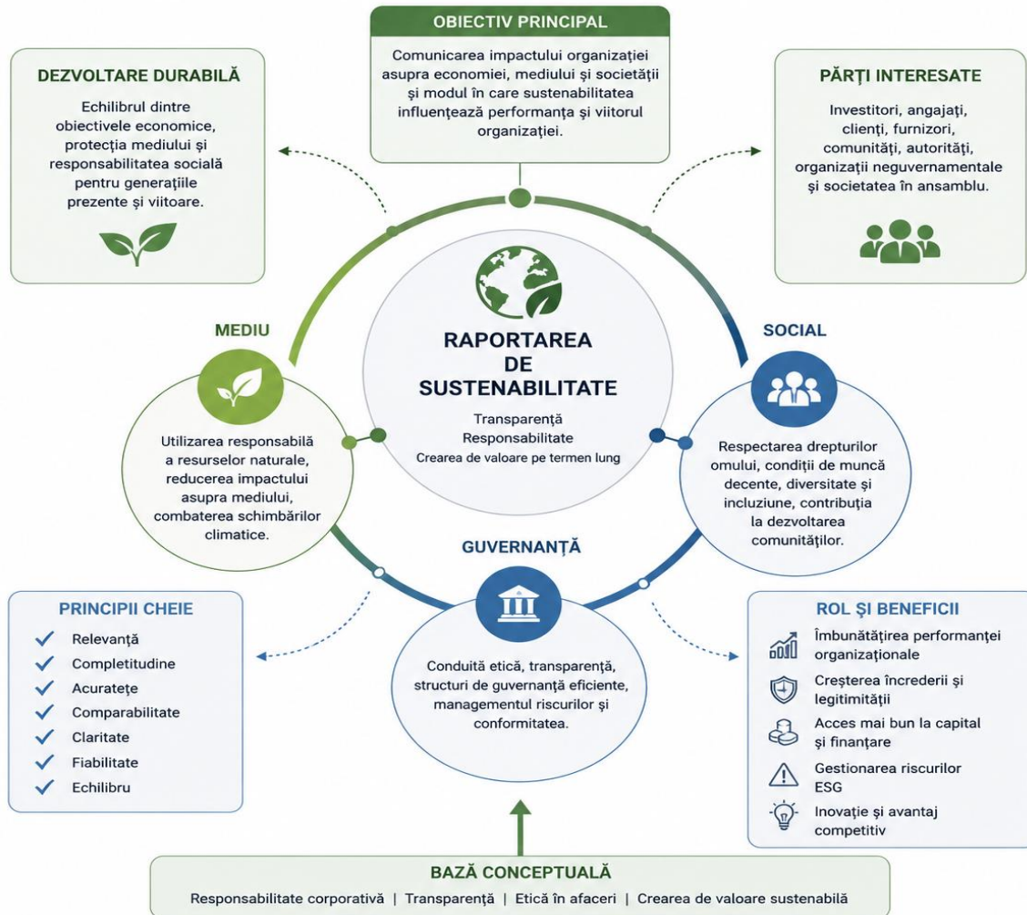
Fig. 1. Elementele fundamentale ale raportării de sustenabilitate

Evaluarea performanței organizaționale în contextul sustenabilității presupune analiza rezultatelor economice, sociale și de mediu ale entității, utilizând indicatori specifici care reflectă gradul de eficiență, responsabilitate și durabilitate. Spre deosebire de evaluarea clasică, care este axată exclusiv pe indicatori financiari, abordarea sustenabilă include și aspectele non-financiare, care oferă o imagine mai completă asupra performanței reale a entității.