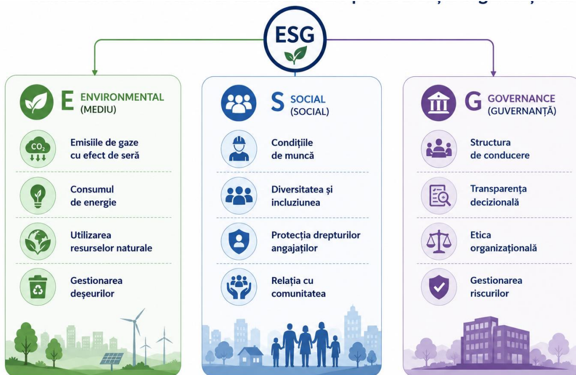
Fig. 3. Indicatorii ESG și dimensiunile performanței organizaționale

Metodologia de evaluare a performanței organizaționale pe baza indicatorilor ESG presupune colectarea, măsurarea și interpretarea datelor nefinanciare prin utilizarea unor standarde internaționale recunoscute. Procesul începe cu identificarea indicatorilor relevanți pentru sectorul de activitate al organizației, continuă cu cuantificarea acestora și se finalizează cu analiza comparativă a rezultatelor în raport cu obiectivele strategice și cu performanța altor entități similare.