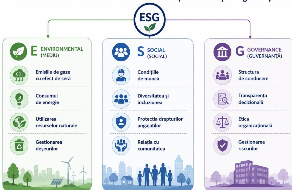
Fig. 3. Indicatorii ESG și dimensiunile performanței organizaționale

Metodologia de evaluare a performanței organizaționale pe baza indicatorilor ESG presupune colectarea, măsurarea și interpretarea datelor nefinanciare prin utilizarea unor standarde internaționale recunoscute. Procesul începe cu identificarea indicatorilor relevanți pentru sectorul de activitate al organizației, continuă cu cuantificarea acestora și se finalizează cu analiza comparativă a rezultatelor în raport cu obiectivele strategice și cu performanța altor entități similare.